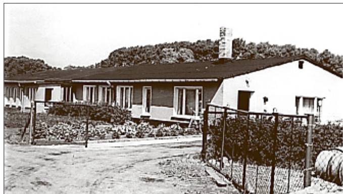
Das Spartenheim im Siedlungsweg 1984

Ein erster Höhepunkt in der Vereinsgeschichte war 1973 der Bau eines Spartenheimes mit Ausstellungshalle. Die Einweihung 1975 mit der Durchführung einer Ausstellung war ein echter Meilenstein. Leider musste das Spartenheim 1993 auf Grund von Rückführungsansprüchen abgegeben werden.