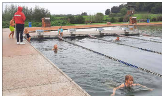
Aktion in der „Südsee“ in Tessin.