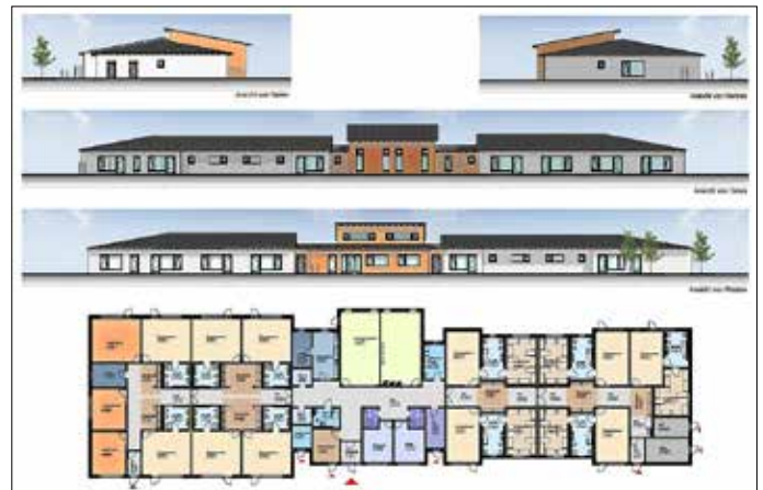
Bild 1 - aktueller Planungsstand KiTa-Erweiterungsneubau

Amtsleiter Bauverwaltung & Gebäudemanagement