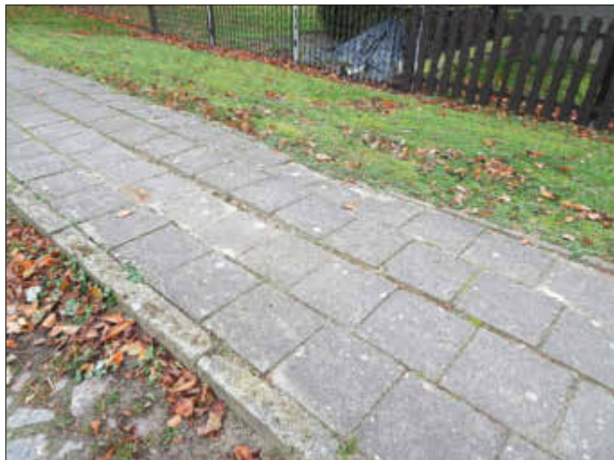
Ausgangssituation Gehweg Liepen

dorf“ in der Ortslage Thelkow und ein kleines Teilstück des Gehweges in der Ortslage Liepen, Höhe Haus Nr. 6. Um die Fußgängersituation an der Straße „Dorfplatz“ in Thelkow zu verbessern, soll ein neuer Gehweg im vorhandenen Grünstreifen angelegt werden. Damit müssen Fußgänger im Kurvenbereich zukünftig nicht mehr auf die Kopfsteinpflasterstraße ausweichen. Als viertes Projekt ist die Reparatur der Gasse in Liepen, Höhe Haus Nr. 9a, vorgesehen. Wir bitten für die notwendigen Verkehrseinschränkungen schon jetzt um Ihr Verständnis.