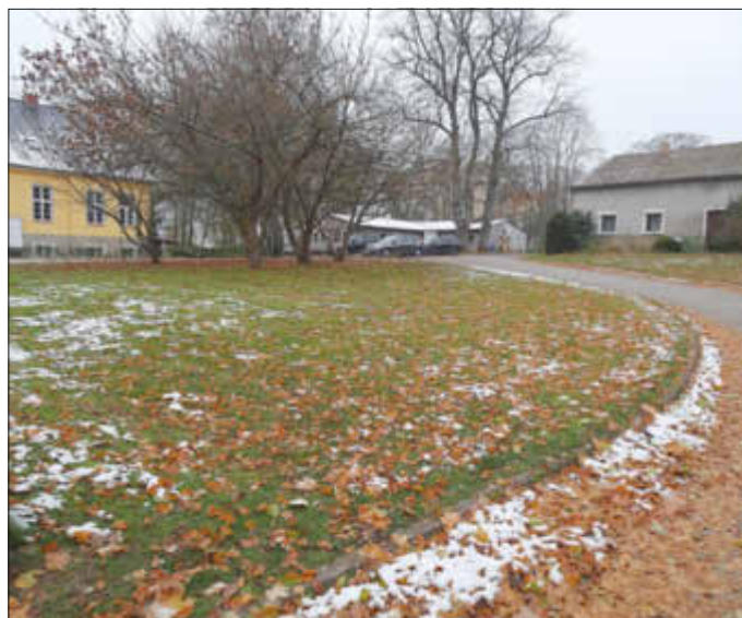
Neuanlage Gehweg Dorfplatz