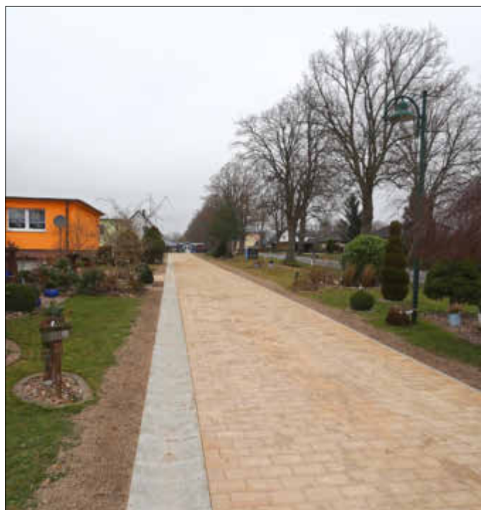
Zustand nach Fertigstellung