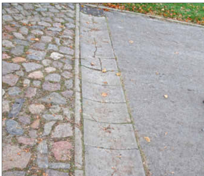
defekte Gasse Liepen