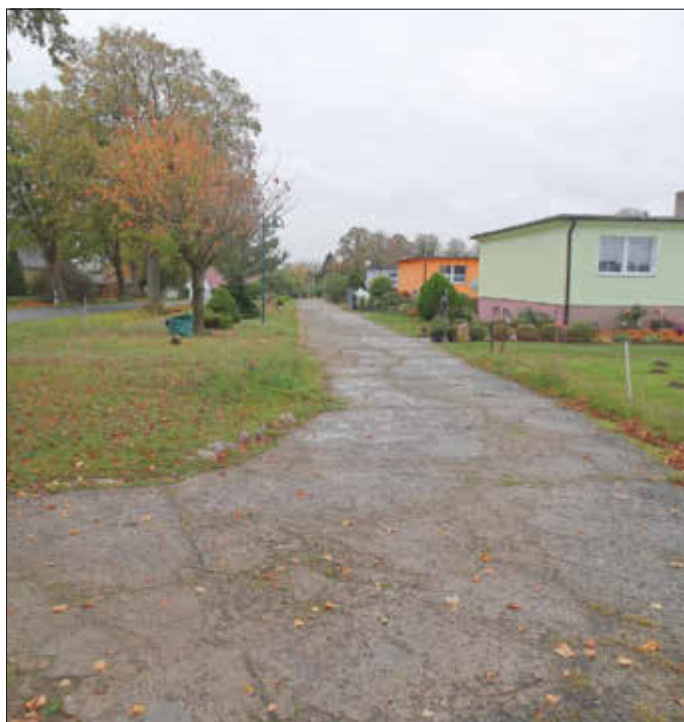
Ausgangssituation vor Baubeginn

Da das Vorhaben im Maßnahmeplan zum Flurneuordnungsverfahren Kowalz als öffentliche Dorfentwicklungsmaßnahme eingestellt ist, konnte eine Zuwendung im Rahmen des Entwicklungsprogramms für den ländlichen Raum Mecklenburg - Vorpommern eingeworben werden. Die Baumaßnahme wurde unter Beteiligung des Bundes im Rahmen der Gemeinschaftsaufgabe „Verbesserung der Agrarstruktur und des Küstenschutzes“ kofinanziert.