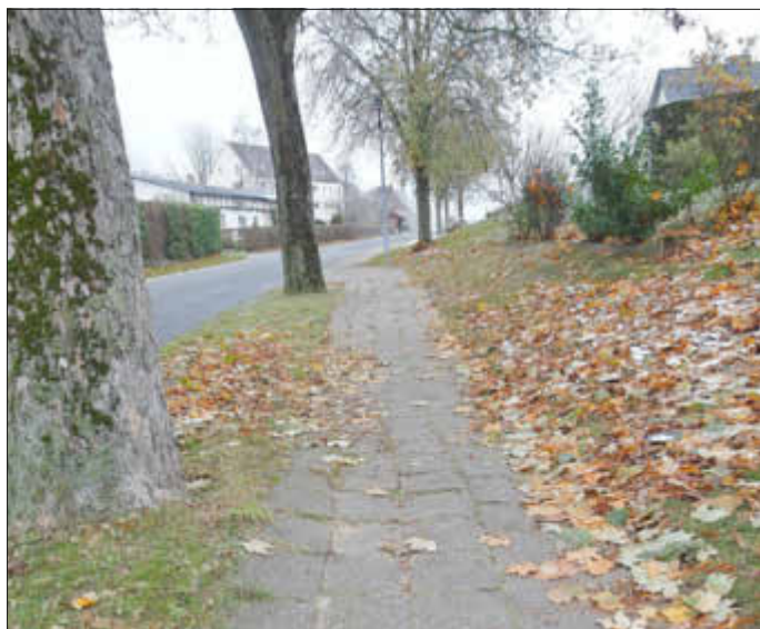
Ausgangssituation Gehweg Oberdorf

setzen bzw. neu zu bauen. Dies betrifft zum einen den dringend sanierungsbedürftigen Gehweg an der Straße „Ober-