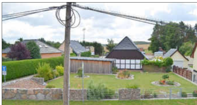
Schönster Vorgarten 2022

Die kalte Jahreszeit neigt sich dem Ende zu. Die ersten Blumen sprießen im Glanze der Frühjahrssonne. Zeit, um die schönsten Anblicke des Jahres vorzubereiten. Auch dieses Jahr ist für die Blumenstadt Tessin ein ganz besonderes Jahr. Als Veranstaltungsort des 32. Landeserntedankfests in Mecklenburg-Vorpommern erwartet die Gäste ein Festgottesdienst mit dem Bischof, ein Festumzug, ein großen Regionalmarkt sowie ein vielfältiges Angebot unserer Vereine und ein buntes Programm.